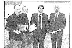
Recogiendo el premio.

El Hospital Universitario Marqués de Valdecilla ha entrega-