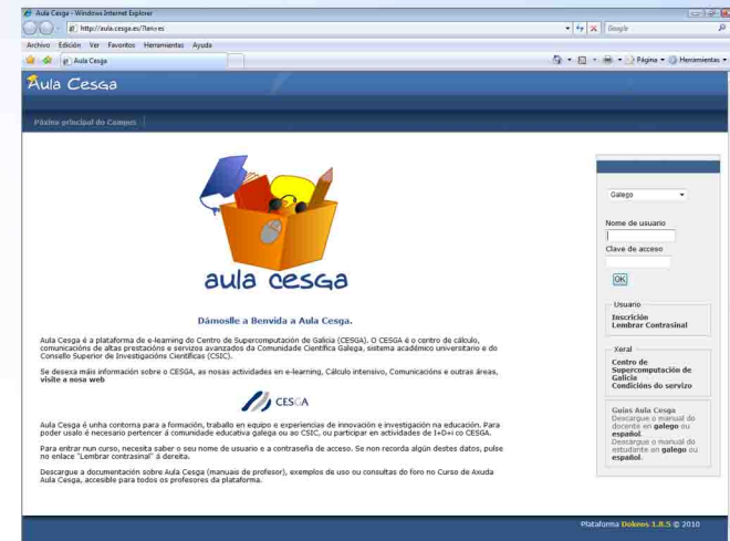
Plataforma de Teleformación

- De acuerdo al artículo 44 del Reglamento de Estudios de Postgrado de esta Universidad, el número de becas ofertadas será del 10% sobre el número de alumnos matriculados. Los criterios de concesión incluirán la valoración del expediente, méritos académicos y la renta por unidad familiar. La cuantía de las becas será del 50% del importe de la matrícula.