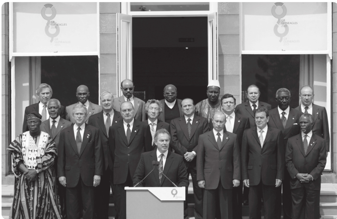
Foto de la familia de los delegados del G8 durante la Cumbredel G8 en Gleneagles, Escocia, en julio de 2005.

C. Coherencia de las políticas, en los países donantes y en los países en desarrollo. Desde el punto de vista de los países menos desarrollados, el desarrollo sostenible sólo podrá conseguirse mediante políticas coherentes e integradas de largo plazo que incorporen claves económicas, políticas, sociales, culturales y ambientales. Deben arbitrase políticas estables que impulsen el crecimiento de la economía, inversiones en desarrollo social, especialmente en educación y salud; la promoción de la participación de todas las personas en la vida política y económica, sobre todo de las mujeres; la buena gestión de los asuntos públicos, la protección de los derechos humanos y la promoción del Estado del derecho; políticas y prácticas respetuosas con el medio ambiente, y medios para la prevención de conflictos y la construcción de la paz.