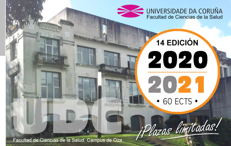
Facultad de Ciencias de la Salud. Campus de Oza