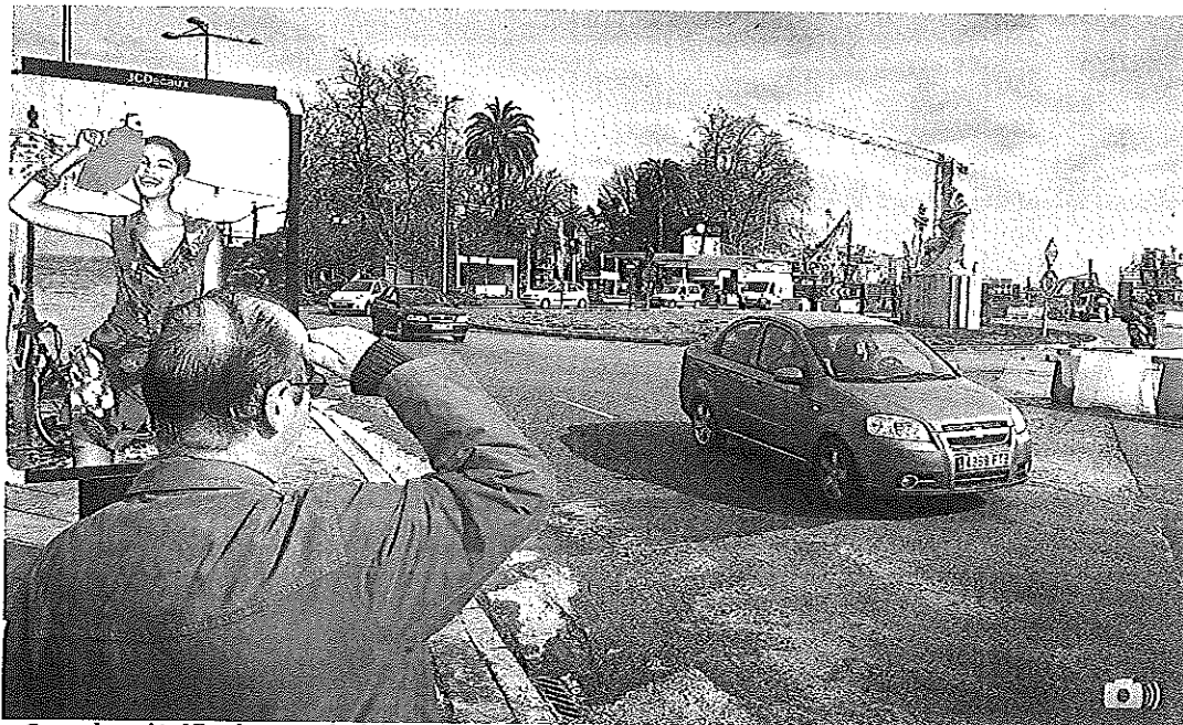
▲ Se reabre al tráfico la rotonda del Bahía. La rotonda del área del hotel Bahía se reabrió ayer al tráfico, tras finalizar los trabajos de cambio de dirección de las tuberías del gas. Ahora comenzarán las obras del túnel junto al Centro de Arte Botín.