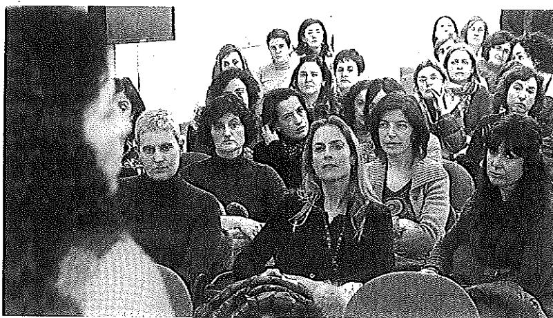
Un centenar de opositores acudió a la asamblea celebrada en el Colegio de Enfermería.

SANTANDER. Los 321 opositores de enfermería de la Oferta Pública de Empleo de 2007 (categoría ATS/DUE) tomarán posesión de sus plazas en mayo. Al menos éste es el último compromiso adquirido por la Consejería de Sanidad, que ayer les informó sobre los motivos que han paralizado el proceso cuando ya se encontraba en su última fase y los plazos pendientes para poder resolver definitivamente la oposición. El anuncio, no obstante, no consiguió levantar los ánimos de un colectivo muy molesto por lo que consideran que «ya es una tomadura de pelo». A estas alturas, «ya no nos creemos nada», se quejaban los afectados. Por eso han tomado la determinación de emprender acciones legales si finalmente este último plazo anunciado se incumple, «como todos los anteriores, porque se están riendo de nosotros».