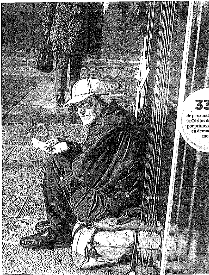
Un hombre pide dinero en una calle de Santander.

SANTANDER. El Ayuntamiento de Penagos aprobará la propuesta de su alcalde, José Carlos Lavín, para abandonar la Federación de Municipios de Cantabria en el pleno ordinario del jueves. La Corporación de Penagos está formada por nueve ediles, seis de Unión por Penagos, el partido del alcalde, y tres del PP, con lo que lo lógico es que el jueves se apruebe esa propuesta de Lavín para dejar la FMC. El alcalde de Penagos considera que este órgano está «dirigido» por el Gobierno regional y no defiende el interés de los ayuntamientos.