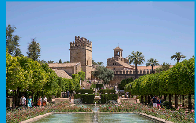
Alcázar de los Reyes Cristianos